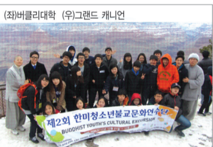
(좌)버클리대학 (우)그랜드 캐니언