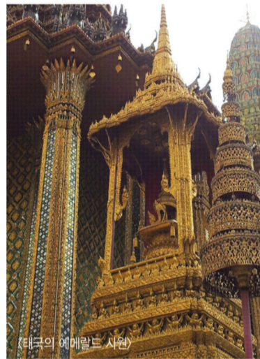
(태국의 에메랄드 사원)

톤턴, 매사추세츠(미국) - 라인함 남쪽 도로의 동쪽에 건설 중인 寺院은 와트 나와민타라라추티스 또는 줄여서 NMR 센터라고 불린다. 프로젝트를 담당하는 사람들은 109,000스퀘어의 복합단지에는 태국 국외에서 가장 큰 태국 불교 명상 센터가 될 것이라고 말하였다. 이 건물은 태국을 통치하였던 라마 9세 푸미폰 아둔야뎃 왕에게 헌정되었는데, 라마 9세는 그의 아버지가 하버드 대학에서 공부하는 동안인 1927년 보스턴지역에서 태어났다. 태국정부는 이 프로젝트에 후원하기로 동의하였다.