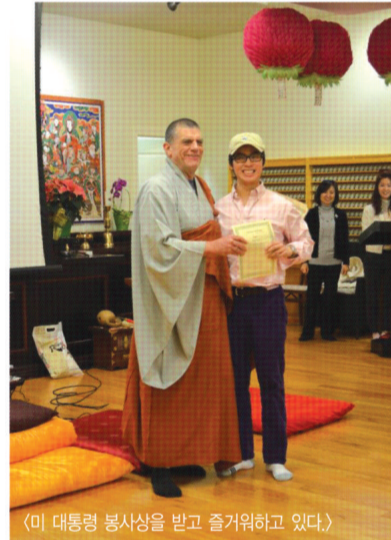
(미 대통령 봉사상을 받고 즐거워하고 있다.)

에 적극 참여하였다. 미동부해외특별교구와 뉴욕불교신도회에서 공동으로 봉사에 참여한 청소년들을 관리하였고, 이를 통해 자격이 충족된 학생 2명에게 봉사상의 꽃인 미 대통령 봉사상을 수여하였다. 행사가 끝난 후에는 연말 파티로 즐거운 시간을 마무리하였다.