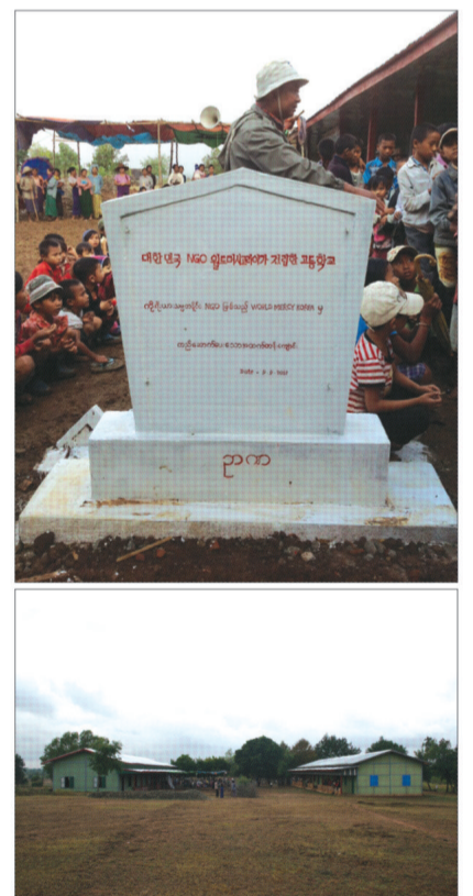
(위)미얀마 레부고교 교사 전경 (아래)교사 준공 기념 표지석

은 이루어졌고, 절반은 학생들의 몫이라며 열심히 공부하여 훌륭한 사람이 되어 사회에 좋은 사람이 되는 것에 항상 기도"하라며, 앞으로도 학생들에게 많은 관심을 둘 것이라고 격려했다.