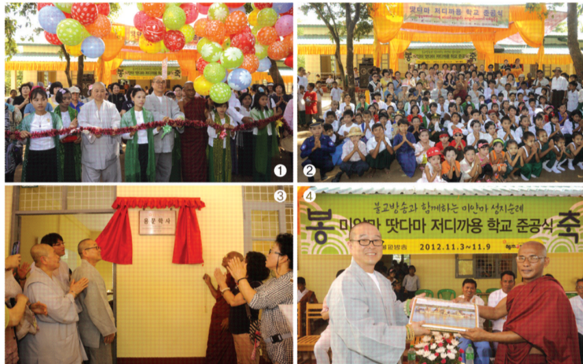
① 용문학사 테이프 커팅 ② 용문학사 학생들과 기념사진 촬영 ③ 용문학사 현판식 ④ 선물 전달

1993년 개교한 땃다마 저디까용 사원 학교는 30여 명의 고아를 가르치는 것으로 시작하여 20년이 지난 현재 1학년에서 7학년까지 초등교육을 받고 있는 학생 수가 509명이나 되는 큰 규모의 학교로 발전해왔다. 5세 이상의 어린이는 종교나 인종과 관계없이 입학할 수 있기 때문에 고아, 극빈층 어린이, 보호자와 함께 살 수 없는 국경과 산악지대 어린이들이 학생의 다수를 이루고 있다. 하지만 기부로 운영되고 있는