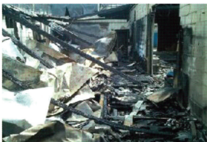
타버린 기숙사 건물

김포 마하 이주민센터 031-985-0654 후원계좌_농협 351-0273-4758-43