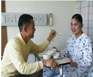
2010년 7월 1차 수술 후 아버지와 함께 한 토안